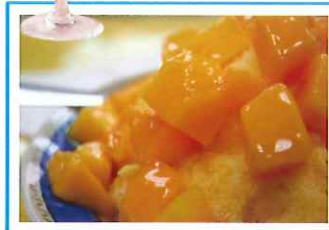
芒果冰 マンゴピン

もちもちなブラックパールの入ったタピオカミルクティー。本場台湾に来たら飲むべき一品。