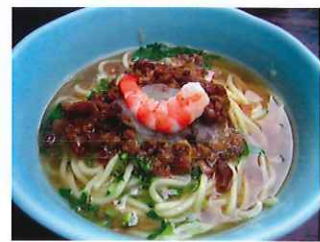
担仔麵 タンツーミン

細かく刻んだ豚肉を、香辛料と煮込んでご飯にかけたB級グルメ。甘辛い煮汁が毎日食べたくなる絶品のおいしさです。