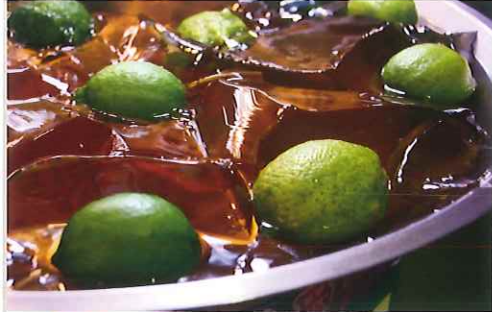
愛玉子 オーギーーチ

「愛玉子」という果実から作られるゼリー。レモンシロップでさっぱりと頂くスイーツです。