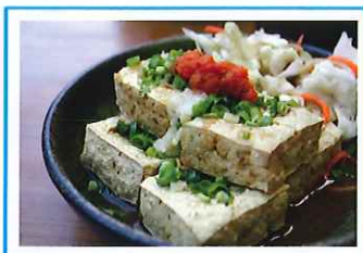
臭豆腐 チョウドウフ

台湾では朝食店が多数あり、長蛇の列ができる人気店も。定番メニューは、温かい豆乳に揚げパンやネギなどの具材が入った「鹹豆漿(シェンドウジャン)」、香ばしい厚焼きのパンに卵焼きを挟んだ「厚餅夾蛋(ホウピンジャータン)」。他にも美味しいメニューが盛りだくさん。朝からお腹いっぱい楽しめます。