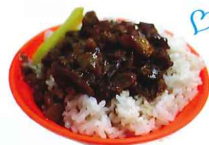
魯肉飯 ルーローハン

甘さ控えめの豆乳を固めたデザート。ピーナッツやタピオカ、フルーツなどをトッピングして、いただきます!夏は冷たく、冬はホットも◎