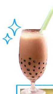
珍珠奶茶 ゼンスーナイチャ

もちもちなブラックパールの入ったタピオカミルクティー。本場台湾に来たら飲むべき一品。