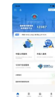
アプリ / WeChatミニプログラム 移民局 12367